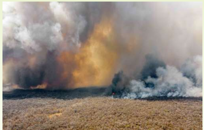
Chiquitania de Bolivia.