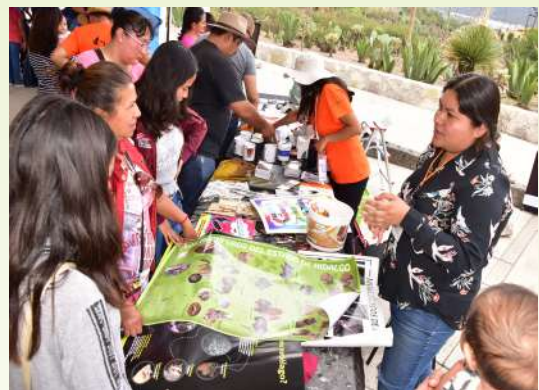
Stand para venta de artículos relacionados con los murciélagos.