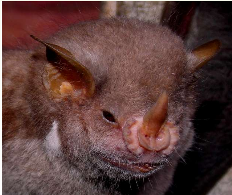
Ejemplar de Stenoderma rufum .

Rodríguez Durán A (2016) Stenoderma rufum . The IUCN Red List of Threatened Species 2016: e.T2074 3A22065638.