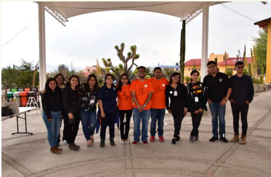
Coordinadores y algunos voluntarios que apoyaron en las diferentes actividades del festival.