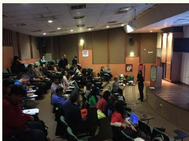
Charla abierta al público en la Facultad de Ciencias Naturales, Universidad Nacional de Salta.