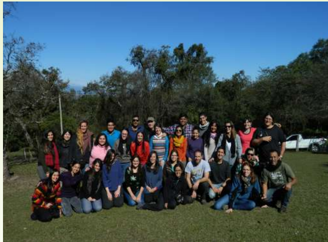
Asistentes al taller en el Museo de la Gesta Güemesiana, ciudad de San Lorenzo (Salta, Argentina).

talleres, nos han permitido llegar al público y construir vínculos con otros actores en algunas de sus sedes. Pero, más importante aún, durante estas reuniones anuales hemos construido vínculos entre compañeros que han llevado a contribuciones laborales (a miles de kilómetros de distancia) y han generado una sinergia y un clima familiar en cada reunión, y deja en cada uno de sus participantes la sensación de sentirse acompañado en cada actividad por el resto de los miembros en cualquier lugar del país. Si entendemos que la conservación es un desafío común y no individual, lo principal es sentirse acompañado en esa tarea, y comprender que el cuidado de las especies, los ecosistemas y en definitiva de nuestro planeta, necesitan de ese trabajo mancomunado, un trabajo que se hace en sociedad, para la sociedad.