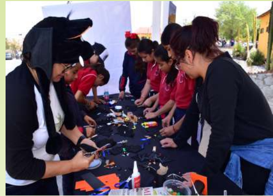
Manualidades desarrolladas con los asistentes al festival de los murciélagos.

9) Taller nocturno “Conociendo a nuestros amigos nocturnos”: esta actividad fue organizada por inscripción previa de los participantes y un cupo limitado. Aunque se inscribieron más de 180 personas, solo se recibieron a 64 de ellas, 27 mujeres (42,2%) y 37 hombres (57,8%). Fue realizada dentro de las instalaciones del Parque Ecológico Cubitos, un área natural protegida (ANP) estatal que conserva un ecosistema de matorral xerófilo y a la cual se le puede considerar una “isla” por estar