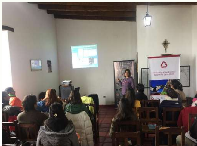
Trabajo interno del PCMA.