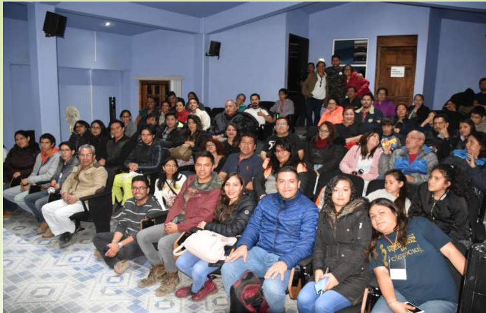
Foto grupal de los asistentes y voluntarios del taller nocturno.