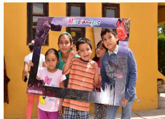
Stand para tomarse fotos como recuerdo del festival del murciélagos.