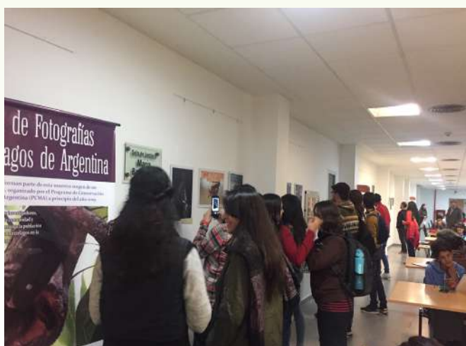
Muestra fotográfica inaugurada durante el X Taller Nacional del Programa para la Conservación de los Murciélagos de Argentina.

La jornada abierta al público en general, que se desarrolla tradicionalmente el primer día del taller, se realizó en la Facultad de Ciencias Naturales de la Universidad Nacional de Salta, con el objetivo de acercar al ámbito académico y a los estudiantes. Contó con la participación de miembros del PCMA, de representantes de la Secretaría de Ambiente y Desarrollo Sustentable y de la Secretaría de Turismo de la Provincia, de la Dirección Regional Noroeste de la Administración de Parques Nacionales y el Decano de dicha Facultad, que participó de la apertura del taller. Los días posteriores, de jornadas internas, se desarrollaron en el Salón del Museo de la Gesta Güemesiana, en la localidad de San Lorenzo, ubicada al oeste de la ciudad de Salta, en un ambiente de Selva de Yungas. Durante estos días de jornadas internas se presentaron los informes de actividades de cada delegación, comisión y subcomisión de trabajo, dándose lugar posteriormente al trabajo en comisiones para el tratamiento de los temas vinculados a cada área. Se finalizó con la presentación de la Provincia de Mendoza