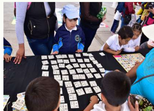
Juego de memorama desarrollado durante el festival de murciélagos.