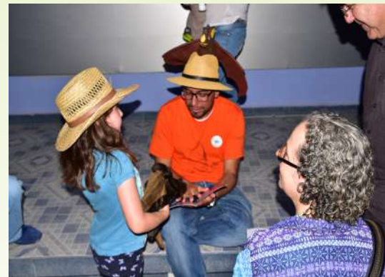
Lectura del cuento "Don Sabino en la Ciudad", que hace referencia a especies en espacios urbanos.