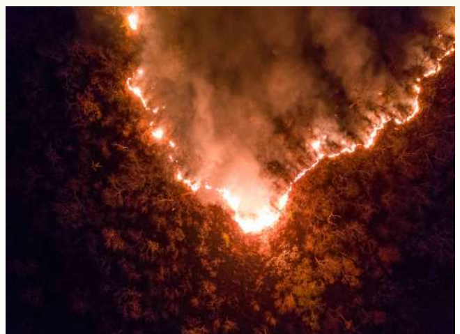
Chiquitania de Bolivia.