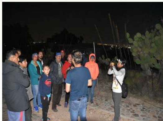
Explicación en campo de la captura y manejo de los murciélagos, así como la importancia de los estudios ecológicos.