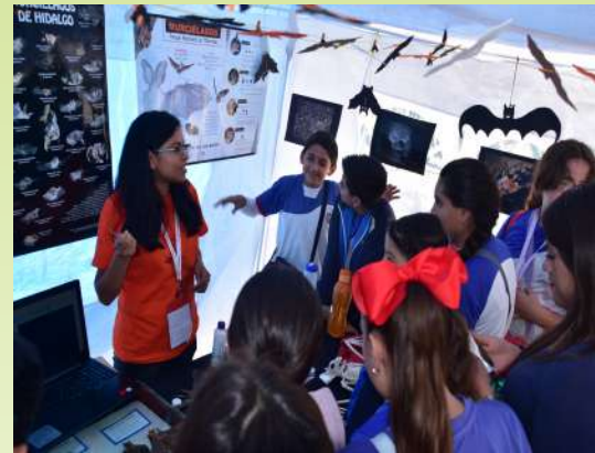
Stand de exhibición con información básica sobre murciélagos.

El festival fue dirigido al público en general y tuvo una asistencia aproximada de 800 personas, desde niños de nivel preescolar hasta adultos mayores provenientes de los municipios de Pachuca, Mineral de la Reforma, Tizayuca, Xochicoatlán, Zempoala y San Agustín Tlaxiaca, además de la Ciudad de México y Querétaro.