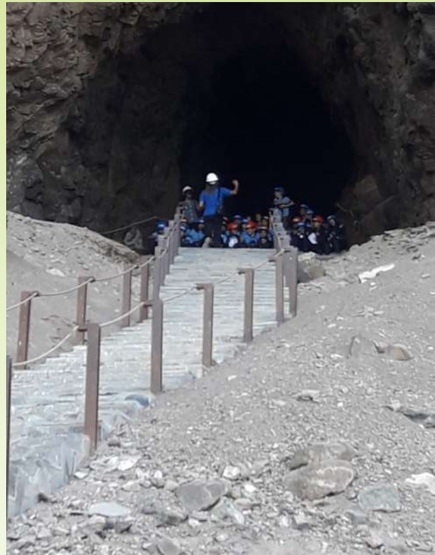
Grupo de estudiantes visitando una de las cuevas de la zona, donde pudieron observar rastros de murciélagos y conocer su importancia. Reportaje "Estudiantes visitaron las Cuevas de Anzota": https://youtu.be/-0rWpZ08QCo