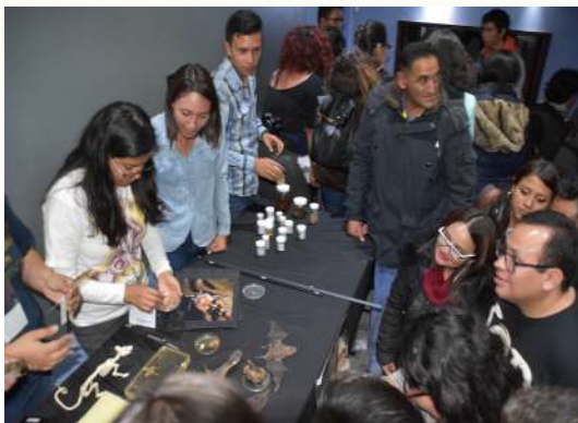
Exhibición de material de colección en aula. Se observan pieles preparadas, material óseo, entre otros.