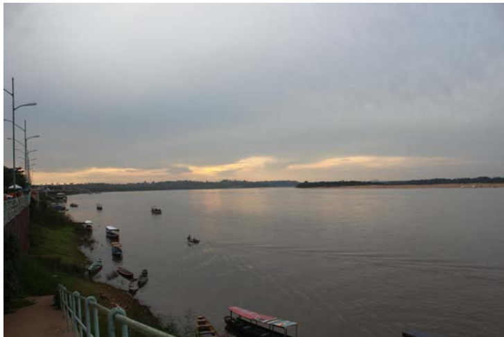
Pilotis com entrada dos morcegos no cais do Porto Marabá, verifica-se ao fundo a vegetação.