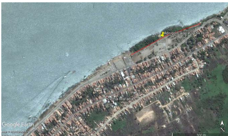
Localização da colônia no Cais do Porto de Marabá no Estado do Pará, Brasil, destacado em vermelho no mapa (Adaptado do Google Earth).