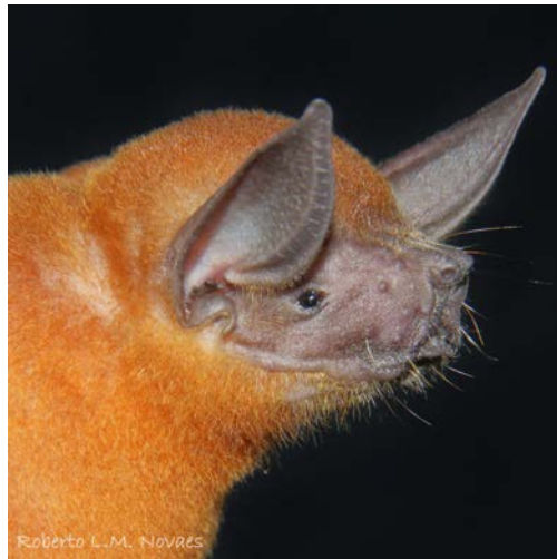
Noctilio albiventris Desmarest, 1818 Morcego pescador pequeno (Noctilionidae)